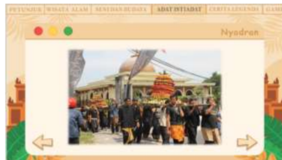
Gambar 7. Halaman ketujuh Web Patriasite

Pada halaman ketujuh ini menampilkan hasil budaya yang berada di Bojonegoro yaitu batik Jonegoroan. Motif khas batik jonegoroan yaitu miwis mukti, motif khayangan api, motif thengul. Terdapat tombol navigasi kiri pertanda kembali dan navigasi kanan pertanda next. Pada halaman ini diiringi dengan soundtrack jawa berupa gamelan.