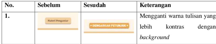
Tabel 6 Revisi Produk

media dan ahli materi untuk pengembangan produk. Berikut merupakan revisi yang dilakukan oleh penelitan.