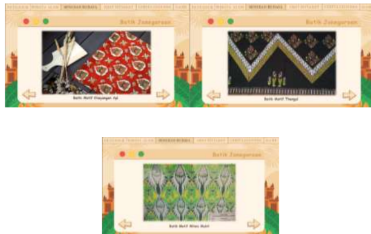
Gambar 6. Halaman keenam Web Patriasite

Pada halaman ketujuh ini menampilkan hasil budaya yang berada di Bojonegoro yaitu batik Jonegoroan. Motif khas batik jonegoroan yaitu miwis mukti, motif khayangan api, motif thengul. Terdapat tombol navigasi kiri pertanda kembali dan navigasi kanan pertanda next. Pada halaman ini diiringi dengan soundtrack jawa berupa gamelan.