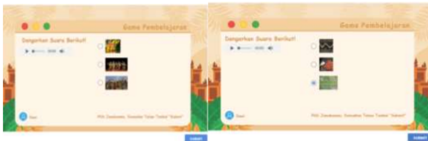
Gambar 10. Halaman kesepuluh Web Patriasite