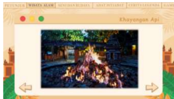
Gambar 4. Halaman keempat Web Patriasite

Pada halaman keempat ini menampilkan wisata alam yang berada di Bojonegoro yaitu Kayangan Api. Kayangan api terjadi akibat Bojonegoro menyimpan banyak cadangan gas alam, selain itu terdapat cerita pembuat besi kerajaan majapahit yang membawa api ke bebatuan. Terdapat tombol navigasi kiri pertanda kembali dan navigasi kanan pertanda next. Pada halaman ini diiringi dengan soundtrack jawa berupa gamelan.