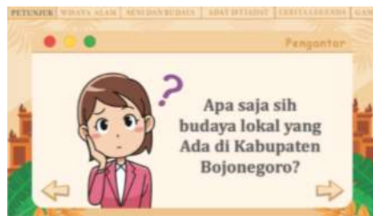
Gambar 3. Halaman ketiga Web Patriasite

Pada halaman kedua ini menampilkan petunjuk tombol-tombol navigasi yang berada di dalam web Patriasite untuk memudahkan pengguna dalam menggunakan media ini. Terdapat tombol navigasi dengarkan petunjuk yang apabila diklik muncul suara penjelasan dari petunjuk. Terdapat tombol navigasi kiri pertanda kembali dan navigasi kanan pertanda next. Pada halaman ini diiringi dengan soundtrack Jawa berupa gamelan.