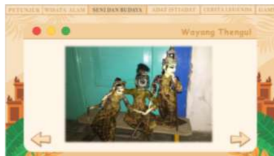
Gambar 5. Halaman kelima Web Patriasite

Pada halaman keempat ini menampilkan wisata alam yang berada di Bojonegoro yaitu Kayangan Api. Kayangan api terjadi akibat Bojonegoro menyimpan banyak cadangan gas alam, selain itu terdapat cerita pembuat besi kerajaan majapahit yang membawa api ke bebatuan. Terdapat tombol navigasi kiri pertanda kembali dan navigasi kanan pertanda next. Pada halaman ini diiringi dengan soundtrack jawa berupa gamelan.