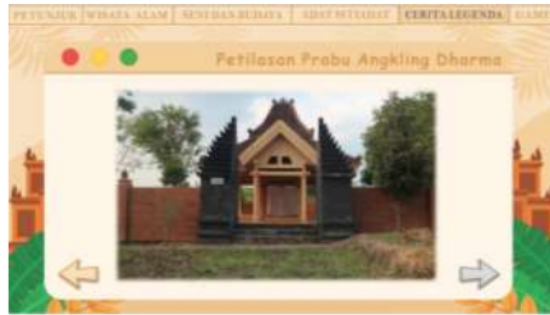
Gambar 8. Halaman kedelapan Web Patriasite

Pada halaman kedelapan ini menampilkan cerita legenda yang beredar di Bojonegoro yaitu Petilasan Prabu Angking Dharma . Terdapat tombol navigasi kiri pertanda kembali dan navigasi kanan pertanda next. Pada halaman ini diiringi dengan soundtrack jawa berupa gamelan.