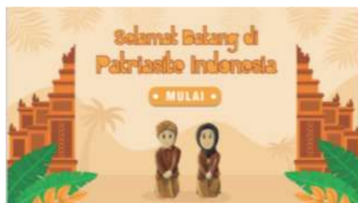
Gambar 2. Halaman awal Web Patriasite