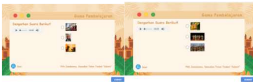
Gambar 9. Halaman kesembilan Web Patriasite

Pada halaman kedelapan ini menampilkan cerita legenda yang beredar di Bojonegoro yaitu Petilasan Prabu Angking Dharma . Terdapat tombol navigasi kiri pertanda kembali dan navigasi kanan pertanda next. Pada halaman ini diiringi dengan soundtrack jawa berupa gamelan.