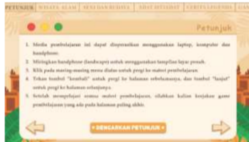
Gambar 3. Halaman kedua Web Patriasite

Halaman awal pada web Patriasite menampilkan kartun laki-laki dan perempuan menggunakan pakaian adat Jawa. Terdapat tulisan Selamat Datang di Patriasite Indonesia dan tombol navigasi mulai. Pada halaman ini terdapat sound penyambutan pengguna dengan ucapan Selamat Datang di Patriasite Indonesia