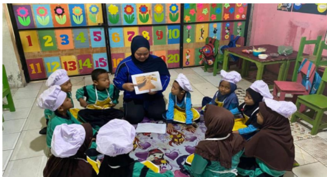
Gambar 3. Kegiatan Sebelum Sentra

Pelaksanaan model pembelajaran sentra cooking class terdapat 4 pijakan yang di lakukan yaitu 1) pijakan lingkungan main, 2) pijakan sebelum main, 3) pijakan selama main, dan 4) pijakan setelah main. Tahapan kegiatan pembelajaran sentra cooking class ini terdiri dari pembukaa, kegiatan inti, istirahat/makan, kegiatan penutupan.