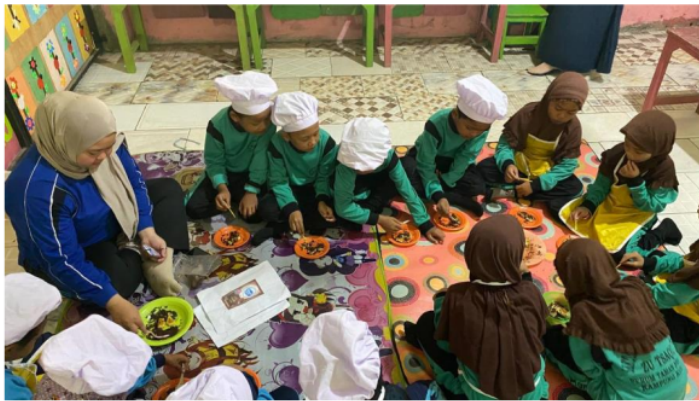
Gambar 5. Kegiatan Makan Bersama

Guru menyampaikan konsep dan subtema serta kegiatan bermain yang akan dilakukan pada kegiatan inti. Pada kegiatan inti ini juga guru akan menerangkan tentang penggunaan alat dan bahan memasak, cara memasak yang baik serta guru juga memberikan arahan untuk berhati-hati terhadap penggunaan alat memasak. Guru akan membagi anak untuk melakukan permainan di sentra cooking class .