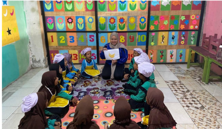
Gambar 5. Kegiatan Penutup/Evaluasi

Kegiatan selanjutnya adalah kegiatan penutup. Kegiatan penutup ini guru akan memberikan kesempatan kepada anak untuk bertanya mengenai pembelajaran sentra cooking class hari ini. Berdasarkan pernyataan di atas dan melalui wawancara peneliti dan kepala sekolah, RA Zu Tsaqif menerapkan pembelajaran sentra cooking class ini setelah 5 tahun berdirinya RA ini. Berikut hasil wawancara yang peneliti lakukan dengan kepala sekolah ibu AL mengenai alasan mengapa model pembelajaran sentra cooking class diterapkan di RA Zu Tsaqif yaitu: “ karena menurut saya pembelajaran sentra cooking class cocok digunakan untuk melatih mandiri anak. Selain itu, kegiatan sentra ini sangat unik sehingga membuat anak menjadi excited dan gembira saat melakukan kegiatan. Pada sentra cooking class ini anak akan memasak makanan mereka sendiri kemudian anak akan memakan hasil buatan mereka sendiri, hal ini anak akan mengetahui bahan-bahan makanan, kemudian anak memegang sebuah tanggung jawab dalam memasak, anak membuka bungkus makanan, memotong, berbagi, dan anak merasa bangga atas makanan yang di buatnya. Oleh karena itu, kegiatan ini memberikan pengalaman baru bagi anak dan dengan memasak aspek perkembangan anak juga bisa berkembang dari kegiatan memasak terutama sikap anak menjadi lebih mandiri “.