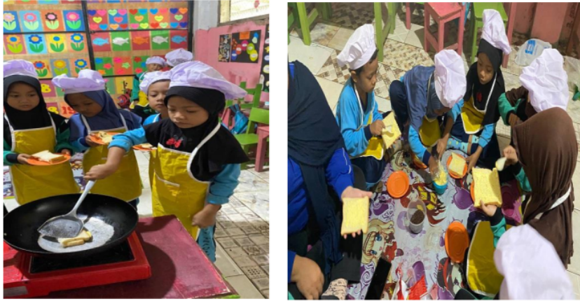
Gambar 4. Kegiatan Sentra Cooking Class

Guru menyampaikan konsep dan subtema serta kegiatan bermain yang akan dilakukan pada kegiatan inti. Pada kegiatan inti ini juga guru akan menerangkan tentang penggunaan alat dan bahan memasak, cara memasak yang baik serta guru juga memberikan arahan untuk berhati-hati terhadap penggunaan alat memasak. Guru akan membagi anak untuk melakukan permainan di sentra cooking class .