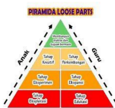
Gambar 2 Piramida Loose Parts

Tahap pertama merupakan tahap eksplorasi. Pada tahap ini anak menjelajahi benda-benda yang ada disekitarnya. Saat anak berada pada tahap eksplorasi, guru memegang peran tahap edukasi untuk mengenalkan strategi bermain, beres-beres dan menyimpan barang. (Yuliati Siantajani), memaparkan bahwa tahap eksplorasi adalah tahap dimana anak mulai berkenalan dengan loose parts , sehingga untuk memenuhi rasa ingin tahunya, anak menjelajahi benda-benda berbagai tekstur, warna, bentuk dan ukuran.