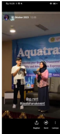
Gambar 4. Pembacaan Adlibs Brand oleh MC di Pertengahan Acara

Dari sisi divisi humas Aquatrance 2023, mereka akan mendapatkan keuntungan berupa dana dan produk dari sponsor yang digunakan untuk membiayai dan mendukung penyelenggaraan acara. Sedangkan dari sisi sponsor, mereka akan mendapatkan keuntungan seperti exposure dari peserta acara Aquatrance 2023. Dengan demikian, strategi Win-Win Solution ini menciptakan situasi saling menguntungkan bagi kedua belah pihak yang terlibat dalam negosiasi.