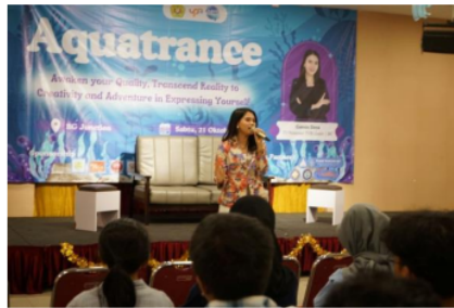
Gambar 1. Pelaksanaan Event Aquatrance 2023

Kosakata yang sering digunakan adalah negosiasi. Dalam hidup kita, kita sering melakukan negosiasi, bahkan tanpa kita sadari. Negosiasi tentunya diperlukan untuk bekerja sama dengan seseorang atau sebuah perusahaan untuk mengurangi perbedaan dan ketidaksepakatan di antara kita. Negosiasi juga dapat membangun hubungan kerja sama selain hanya mengurangi ketidaksepakatan. Mulai dengan mempersiapkan topik perundingan, berkonsentrasi pada hasil yang diinginkan, dan mendorong pihak lain untuk mencapai hasil yang diinginkan.