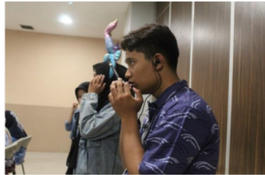
Gambar 2. Penggunaan Handy Talkie Hasil dari Sponsorship