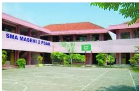
Gambar 1. Observasi Mitra

Observasi dilakukan pada hari Kamis, 21 Maret 2024 di SMA Masehi 02 PSAK, untuk melihat kondisi fisik dan sosial sekolah. Berikut hasil dokumentasi dari observasi yang sudah dilakukan: