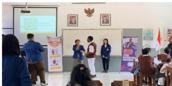
Gambar 4. Sesi Ice Breaking

Setelah sesi pemberian materi, para siswa kemudian di ajak untuk Ice breaking atau bermain Tebak-tebakan agar tidak merasa bosan saat materi yang dipaparkan. Berikut merupakan momen kegiatan Ice breaking yang berhasil diabadikan: