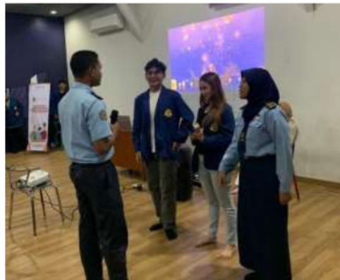
Gambar 3.2 sesi tanya jawab

Dalam pembekalan materi tersebut, pada dokumentasi diatas berlangsungnya pemberian materi menjelaskan dasar-dasar bagaimana melakukan atau cara membuat sebuah advertorial yang dimana advertorial sendiri merupakan promosi berbasis konten secara tidak langsung yang dibagikan kepada masyarakat. Pembagian materi ini memberikan respon positif dari para siswa yang mengikuti kegiatan PKM yang dilakukan oleh mahasiswa dari Universitas Semarang.