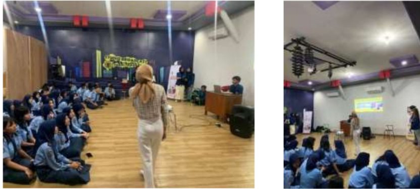
Gambar 3.1 pemberian materi

Dalam pembekalan materi tersebut, pada dokumentasi diatas berlangsungnya pemberian materi menjelaskan dasar-dasar bagaimana melakukan atau cara membuat sebuah advertorial yang dimana advertorial sendiri merupakan promosi berbasis konten secara tidak langsung yang dibagikan kepada masyarakat. Pembagian materi ini memberikan respon positif dari para siswa yang mengikuti kegiatan PKM yang dilakukan oleh mahasiswa dari Universitas Semarang.