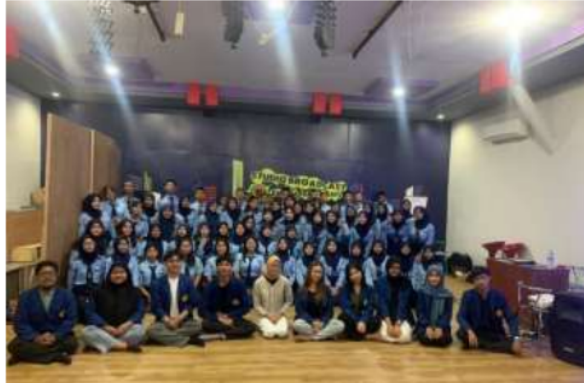
Gambar. 3.3 foto bersama dan pembuatan konten

Dalam hal tersebut pula, advertorial berfokuskan dalam promosi digital marketing melalui produksi konten dengan gaya penulisan jurnalistik yang lebih halus. Tujuannya sendiri untuk mempromosikan produk atau layanan secara tidak langsung namun tersirat sebagai artikel editorial menjadi iklan lebih informatif dan jelas. Adapun jenis- jenis advertorial yaitu: