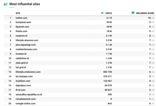
Gambar 3. Data Media Berita Online Yang Membahas Mengenai LAKON Indonesia Bulan Maret 2023