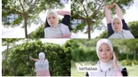
Gambar 6. Scene 6