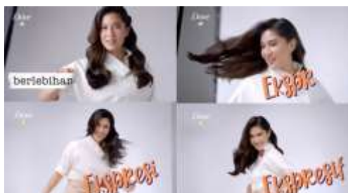
Gambar 8. Scene 9