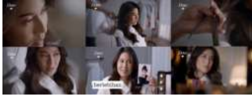
Gambar 2. Scene 2