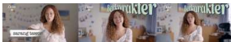
Gambar 9. Scene 10