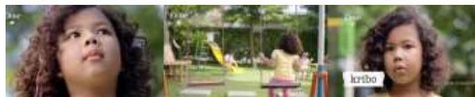
Gambar 3. Scene 3