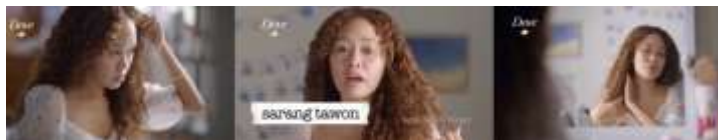
Gambar 4. Scene 4 (Sumber: YouTube Dove Indonesia)