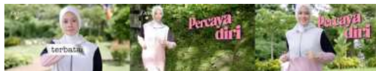
Gambar 12. Scene 13