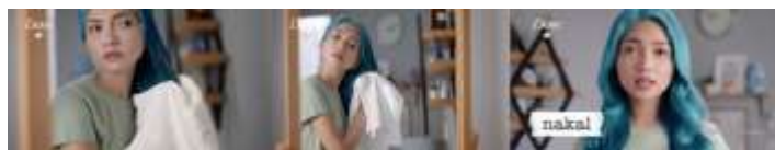
Gambar 5. Scene 5