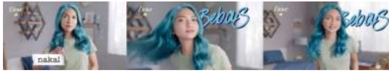
Gambar 10. Scene 11