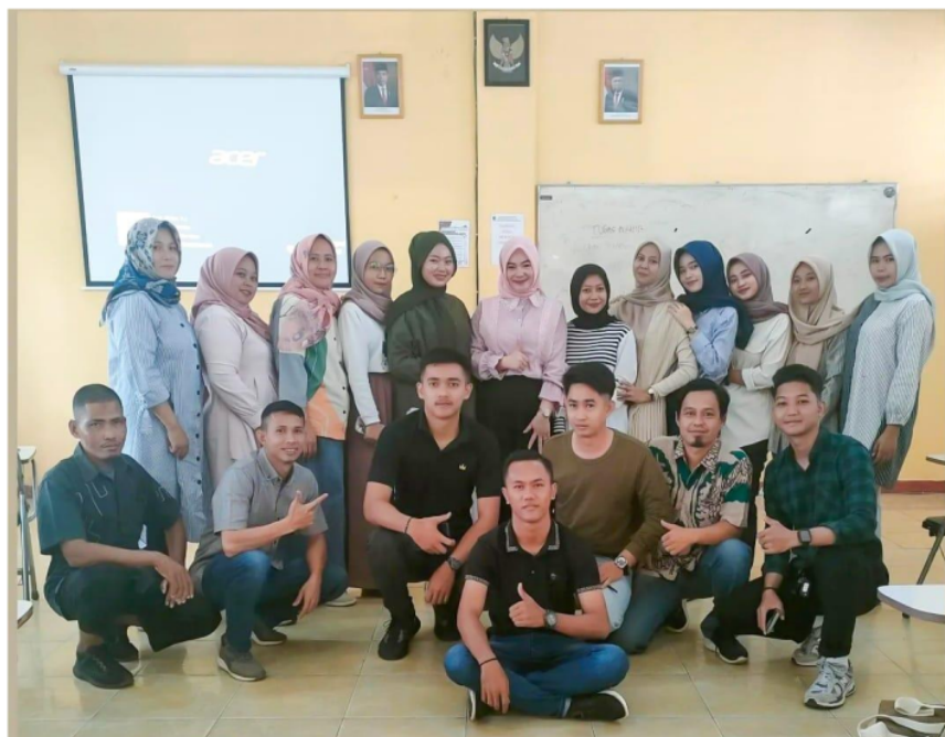
Gambar 3. Foto Bersama Peserta Pelatihan.