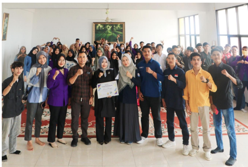
Gambar 4. Foto Bersama Peserta Pelatihan.