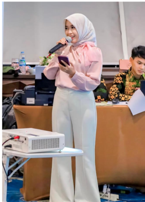
Gambar 2. Penyampaian Materi II.