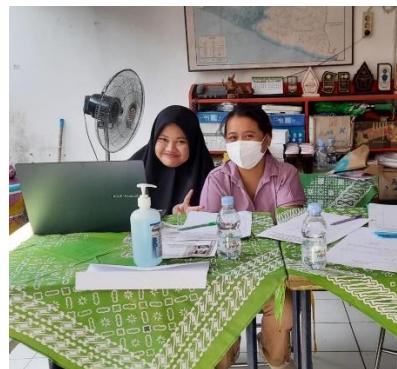
Gambar 3. Pendampingan Pembuatan Laporan Keuangan Di Kantor Kelurahan Maguwoharjo

Pengabdi memberikan pengarahan kepada Kantor Kelurahan Maguwoharjo untuk melakukan pembuatan Laporan Keuangan menggunakan Ms. Excel Berbasis Akrual sederhana untuk memasukan data belanja dan pendapatan selama setahun di Kelurahan Maguwoharjo terbilang Tahun 2022.