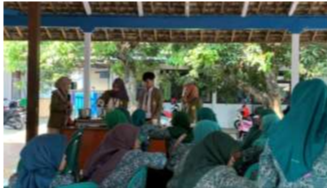
Gambar 4. Demonstrasi Pembuatan Produk Olahan Bunga Telang