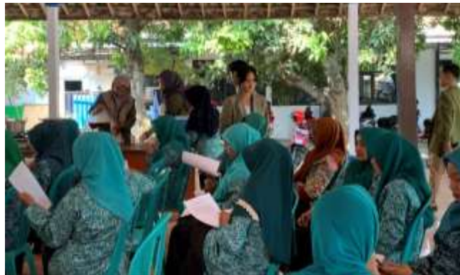
Gambar 5. Pemberian kuisioner dan sample minuman dari olahan buga telang