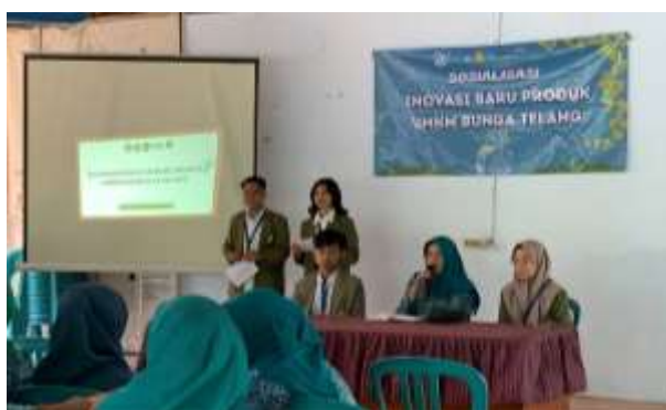
Gambar 2. Pembukaan Kegiatan Sosialisasi