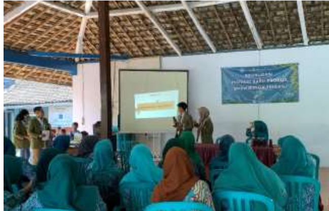
Gambar 3. Penyampaian Materi Sosialisasi