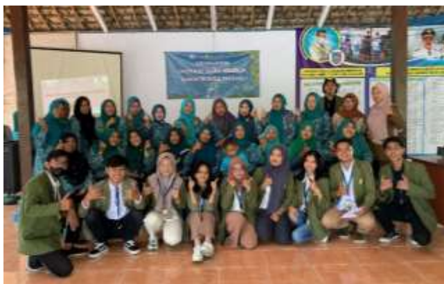
Gambar 1. Peserta Sosialisasi Pemanfaatan Bunga Telang Sebagai Inovasi Produk Lokal Baru Di Desa Japanan

Pada kegiatan sosialisasi ini kami menjelaskan tentang tanaman telang itu sendiri serta khasiat yang terdapat pada bunga telang. Kami juga menjelaskan cara pembudidayaan tanaman telang kepada peserta yang berpartisipasi dalam kegiatan ini serta memberikan informasi berupa harga tanaman telang yang ada pada pasaran saat ini, mulai dari harga bibit tanaman telang dan harga bunga telang kering. Berikut merupakan rangkaian kegiatan sosialisasi pemanfaatan bunga telang: