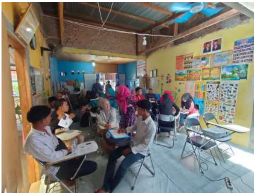
Gambar 3. Diskusi yang diikuti para peserta didik dari PKBM