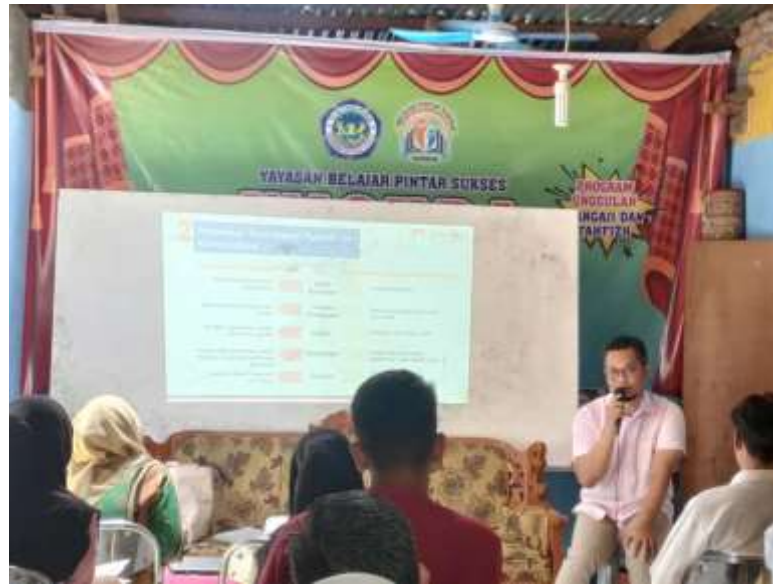
Gambar 2. Presentasi materi oleh salah seorang anggota PKM