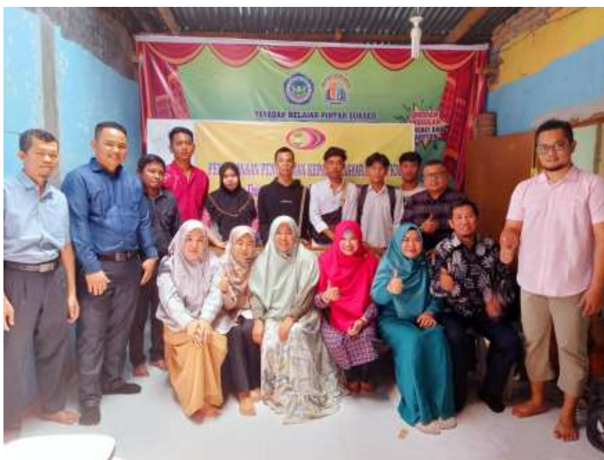
Gambar 4. Photo bersama peserta dalam kegiatan PKM