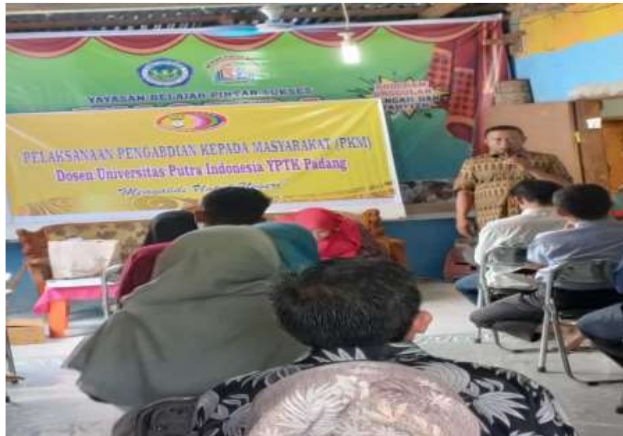
Gambar 1. Sambutan dari Kepala Sekolah PKBM

Sebagai seorang pengusaha atau calon pengusaha, tentunya spirit dalam menjalankan usaha tidak boleh luntur atau patah semangat. Motivasi usaha merupakan suatu hal penting yang harus ada dalam diri setiap entrepreneur muda atau yang sudah berpengalaman. Tanpa adanya sebuah motivasi, bisa dipastikan segala sesuatunya termasuk impian yang selama ini diidam-idamkan akan terasa sangat sulit untuk dicapai dan diperluas kesuksesannya.