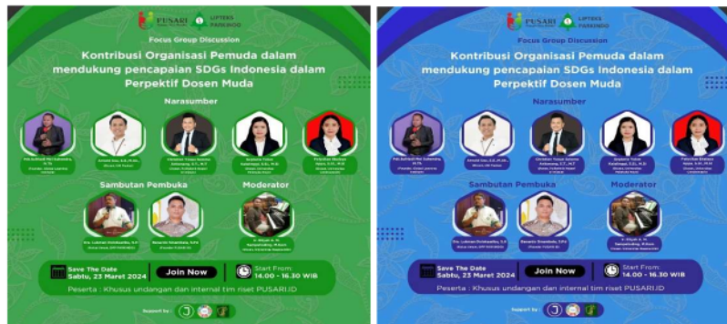
Gambar 2. Poster Publikasi

Publikasi dilakukan menggunakan poster sehingga kegiatan dapat tersampaikan secara informatif dan menarik (Pongtambing, et al. 2023). Poster kegiatan ditunjukkan pada Gambar 2.