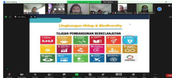
Gambar 5. Ada Gambaran SDGs

Organisasi masyarakat sipil termasuk dalam hal ini Organisasi emuda memainkan peran penting dalam mengadvokasi keadilan sosial, mendorong keterlibatan masyarakat, dan memperkuat suara komunitas yang terpinggirkan. Melalui mobilisasi para anggotanya, pemberdayaan masyarakat, dan advokasi kebijakan. Organisasi berkontribusi terhadap akuntabilitas, transparansi, dan tata kelola yang inklusif, sehingga memperkuat tatanan sosial dan memastikan tidak ada seorang pun yang tertinggal dalam upaya mencapai SDGs.