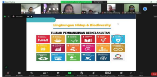
Gambar 3. Narasumber dan Moderator

ucapannya, DPP PARKINDO menggarisbawahi pentingnya peran aktif dari semua pihak untuk mencapai tujuan bersama dalam pembangunan berkelanjutan.