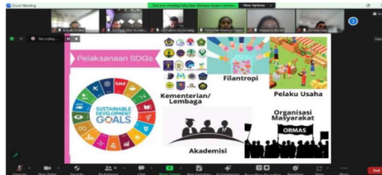
Gambar 4. SDGs dan konsep dukungan

Selanjutnya pihak PUSARI ID dalam hal ini Benardo Sinambela memberikan sambutan. Dalam konteks ini, Benardo Sinambela, sebagai Pendiri PUSARI ID, memperkenalkan PUSARI ID sebagai sebuah komunitas yang telah secara aktif beroperasi sejak tahun 2019, telah rutin melakukan kajian serta menyelenggarakan webinar. Sinambela secara eksplisit mengemukakan harapannya bahwa Organisasi Pemuda dapat memainkan peran yang signifikan dalam menggalang kemajuan, terutama di tingkat desa, dengan landasan yang kokoh pada kajian atau pendekatan akademis yang mendalam.