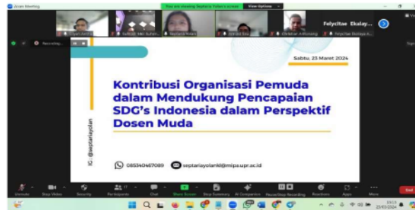
Gambar 5. Narasumber memaparkan pandangannya

Peran Akademisi melalui institusi nya berfungsi sebagai pusat penciptaan pengetahuan, penelitian dan inovasi yang terkait dalam kontribusinya pada pembangunan berkelanjutan. Dengan penelitian dari berbagai ilmu (interdisipliner), akademisi harus mampu memberikan keahlian, nalar kritis dan pedoman yang tepat dalam membangun. Institusi pendidikan harus berbasis bukti dalam mendukung kebijakan dan praktik yang berhubungan dengan SDGs. Harapannya, institusi melalui akademisi memiliki peran dalam mengintegrasikan SDGs pada kurikulum mahasiswa dengan tujuan mempersiapkan masa depan dengan pengetahuan, keterampilan dan kesadaran untuk mencapai SDGs tersebut.