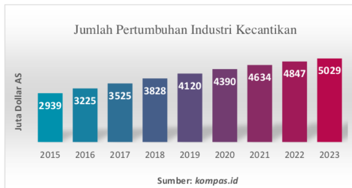
Gambar 1. Jumlah pertumbuhan industri kecantikan

Di Indonesia, peralihan dari belanja offline ke belanja online telah menyebabkan peningkatan signifikan dalam belanja online . Belanja offline memungkinkan konsumen untuk membeli dan membeli produk secara langsung, sedangkan belanja online memungkinkan konsumen untuk melihat dan membeli produk melalui gambar, video, dan deskripsi. Namun, belanja online memiliki keterbatasan, seperti risiko pengiriman produk yang tidak memenuhi harapan konsumen. Sebagai kesimpulan, era digital telah memberikan dampak yang signifikan terhadap berbagai aspek kehidupan manusia, termasuk teknologi informasi, komunikasi, dan industri kecantikan. Penggunaan teknologi AR juga berkontribusi terhadap pertumbuhan industri kecantikan dan pengembangan produk serta layanan baru (Nazwa, 2023).